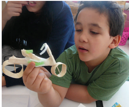
A student showing off the motorcycle he built!

"You have brains in your head. You have feet in your shoes. You can steer yourself any direction you choose." - Dr. Seuss