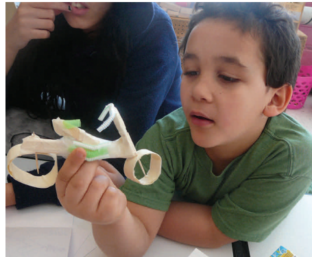
¡Un estudiante demostrando la motocicleta que construyó!

"Usted tiene el cerebro en su cabeza. Usted tiene los pies en sus zapatos. Puede dirigir a sí mismo cualquier dirección que elija." - Dr. Seuss