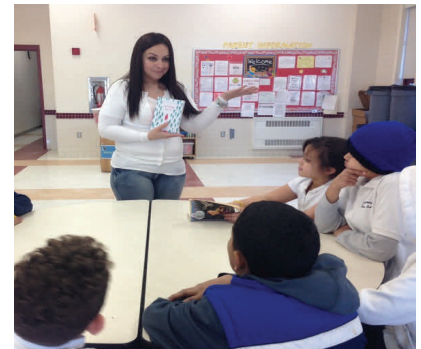
Students with Nelly reading a book from the Latchkey Library!

Latchkey is excited to introduce our students to our newly established Latchkey Libraries at each site! Every student has been issued a Latchkey Library card which they have signed and agreed to abide by library rules. Each group at every site has a day and time designated to check out a book and they are able to keep them for one week. The students have enjoyed this so much that we're looking to expand our collections! Students have also just finished their eight week study of transportation. Each group made time lines for different types of transportation, including trains, cars and planes. They also received the chance to learn about the Wright Brothers and the history of flight. The children were excited to learn that