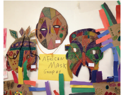
¡Los estudiantes están emocionados de comenzar la siguiente unidad de estudio!

"Usted tiene el cerebro en su cabeza. Usted tiene los pies en sus zapatos. Puede dirigir a sí mismo cualquier dirección que elija." - Dr. Seuss