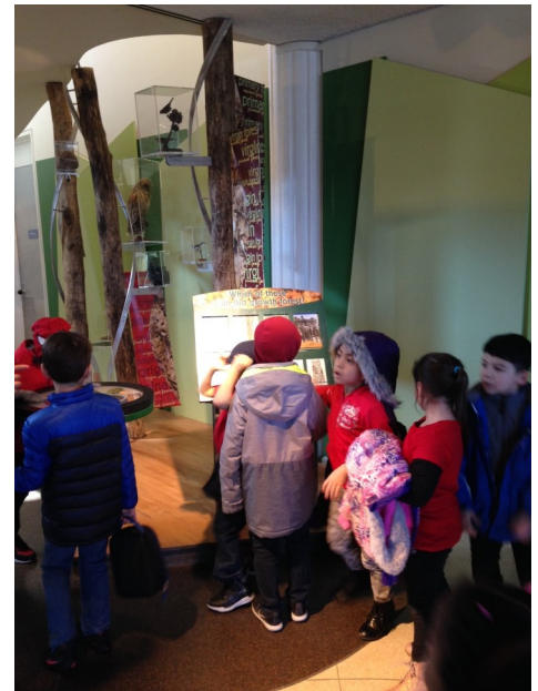
Students learned about the forms of life that are hidden within the forests of New England.

As the weather improves, we plan to take advantage of spring in New England.