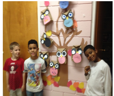
Students proud of their owl art work.

In the upcoming months, the Latchkey Enrichment Program will be having a partnership with the NECC and Cambridge College. The primary focus of this partnership is for college students to gain experience in the field of education, build on their resumes and earn practical hours needed for their coursework. This partnership is beneficial and a great asset for all involved. The college students offer hands-on, academic tutoring, reading assistance to increase proficiency and aptitude, pronunciation of words, and one on one groups with any child who has difficulty in their academics. This will be a great example to the community of Lawrence and the Latchkey Afterschool